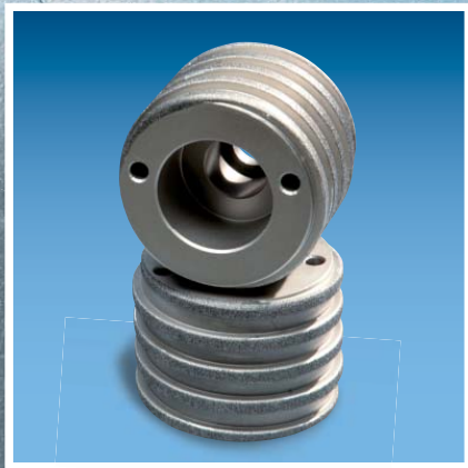
Mole / Wheels